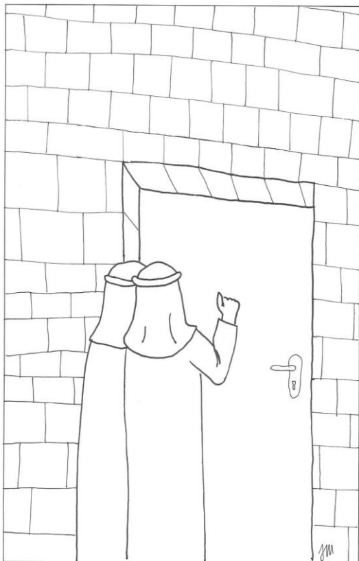
Slavnost svatých Cyrila a Metoděje Lk 10,1-9