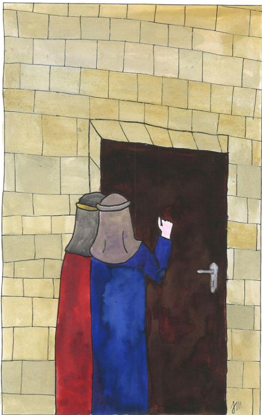
Slavnost svatých Cyrila a Metoděje Lk 10,1-9