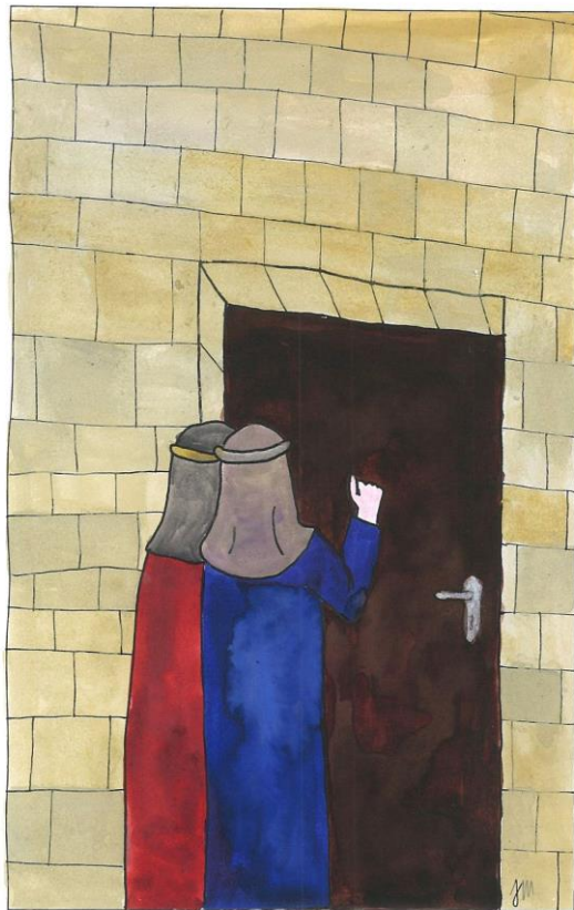
Slavnost svatých Cyrila a Metoděje Lk 10,1-9